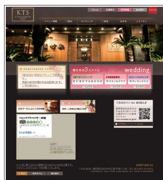
KURETAKESO HP http://www.villa-kuretake.co.jp/