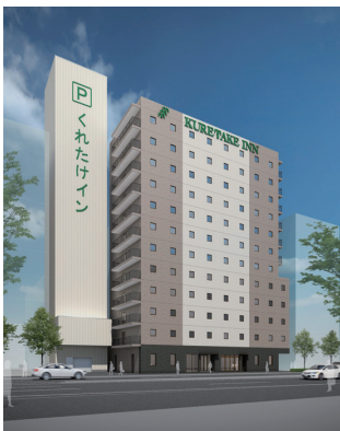
[HOTEL] くれたけインプレミアム静岡 JR静岡駅前 H26年OPEN予定

※1) 2012年10月に、『PCA for SaaS』から『PCAクラウド』へ名称を変更いたしました。