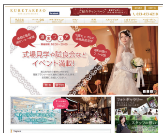
KURETAKESO ホテルウェディング HP http://www.kuretake.jp/

いち早くクラウドサービスを導入し、その効果が形となって現れている呉竹荘。個人消費が伸び悩む中でも着実に営業利益を生みだし、人気ホテルウェディングの上位にランキングされるなど、経営には「先見性」というキーワードがあてはまるようだ。今回のクラウド導入についても代表取締役社長である山下智司氏の判断とパワーが大きかったと高橋氏は語る。呉竹荘では今年も新しいホテルのオープンを控えており、各店舗・支社と本社を結ぶクラウドサービスの価値はさらに高まりそうだ。