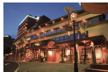
KTS [BRIDAL] KURETAKESO(呉竹荘)

浜松では「KURETAKESO」の存在や流行に敏感な結婚式は、これまで1万9千組ものカップルに選ばれました。これからも、思い描く結婚式を提供し続けていきます。