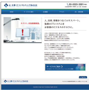
辻・本郷 ITコンサルティング(株) HP http://www.ht-it.jp/