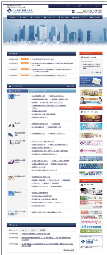
辻・本郷 税理士法人 HP http://www.ht-tax.or.jp/