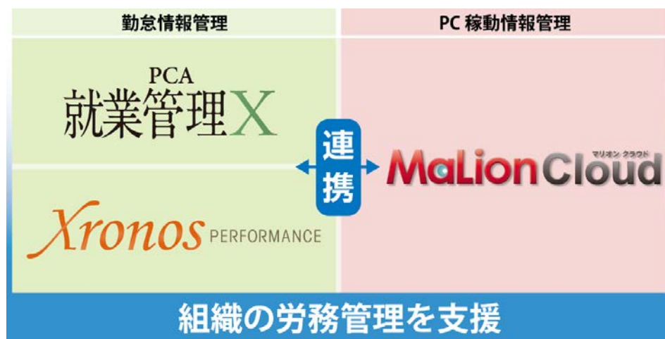
労務管理支援 - 連携ソリューション概念図

本ソリューションは、ピー・シー・エーが提供する就業管理システム「PCA 就業管理 X シリーズ (ピーシーエー シュウギョウカンリ エックスシリーズ)」、あるいはクロノスが提供する就業管理システム「クロノス Performance (クロノス パフォーマンス)」を、インターコムが提供する情報漏洩対策+IT 資産管理システム「MaLionCloud for PCA (マリオンクラウド フォー ピーシーエー)」と連携させることで実現します。