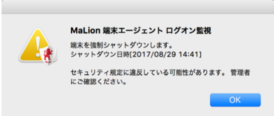
警告表示 (従業員向け)