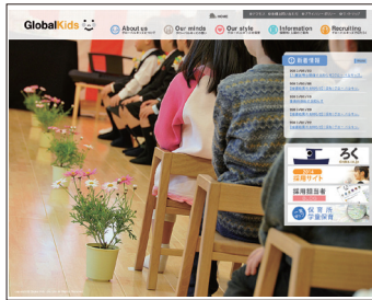
株式会社 グローバルキッズ HP http://www.gkids.co.jp

受講管理など今後の評価を行うのに必要な情報も管理対象にしていきたいと考えています。年次別の研修カリキュラムやキャリアプランを考えていく場合に参考にできれば良いかなと。」